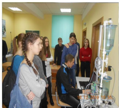
Проориентационные экскурсии на базе колледжа