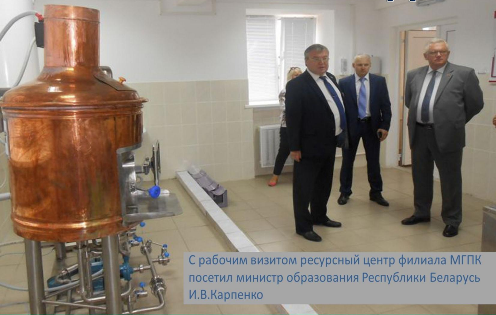
С рабочим визитом ресурсный центр филиала МГПК посетил министр образования Республики Беларусь И.В.Карпенко