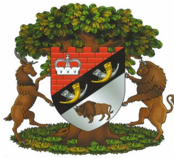
Герб Беловежской пушчи