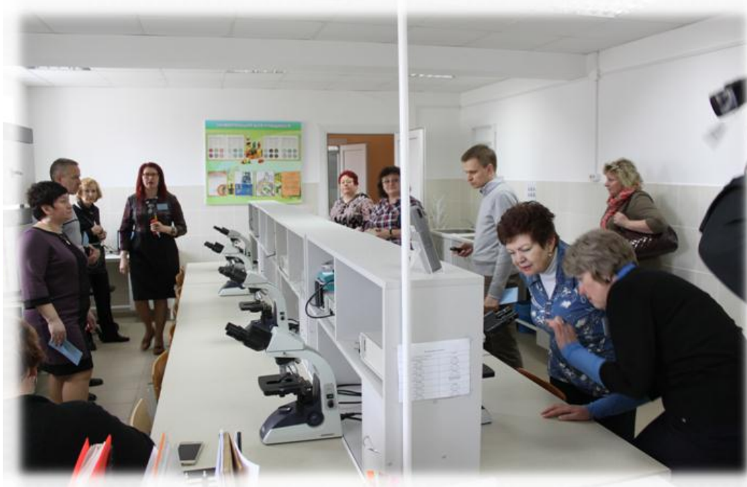
Представители СМИ на базе ресурсного центра