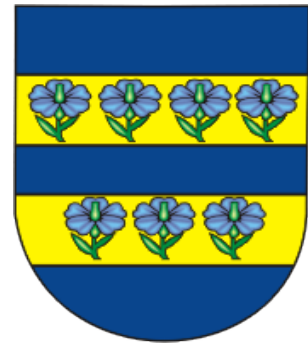
Герб г. Кореличей