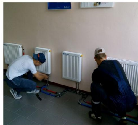
Новые специальности – новое образование