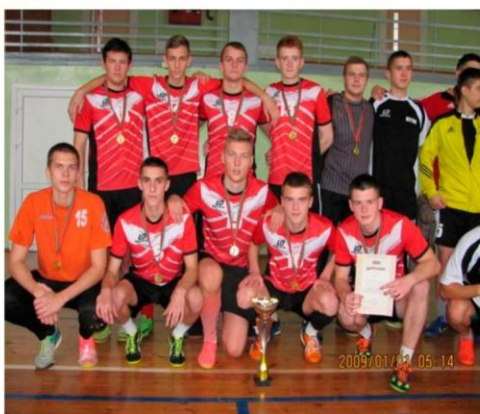
1 место в областном турнире по мини-футболу