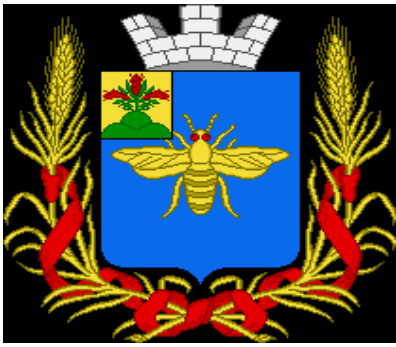
Герб г. Климовичи